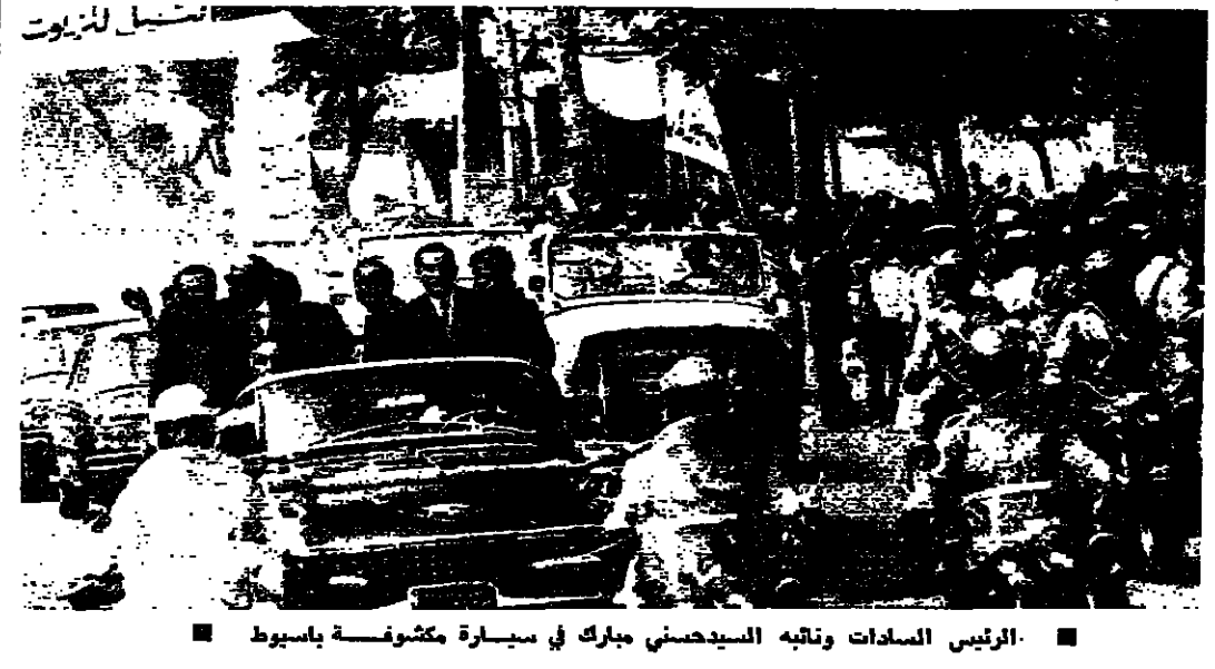
الرئيس السادات وتيابه السيد حسني مبارك في سيارة مكشوفة باسبوط ■

معلومات جديدة عن تعيين نائب الرئيس المصري وقد اختار السيد حسني مبارك باختياره واحدا من القادة الخمسة الذين كانوا في القيادة العليا مع الرئيس السادات بليون مركة تشرين الأول ، وهم المشير اسماعيل ، والتخريف عبد الفاني الجبلي ، والتخريف علي فنيي قائد المواربيخ ، والتخريف حسني مبارك قائد الطيران ، وصحة السادات